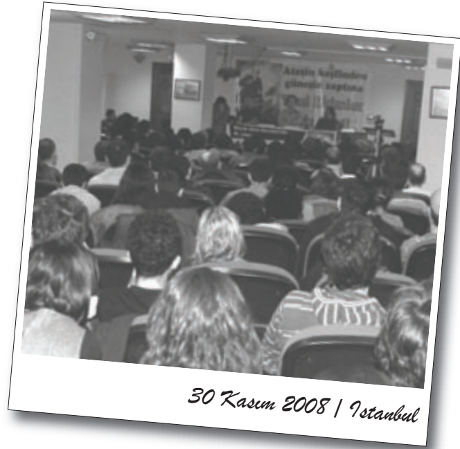
30 Kasım 2008 | İstanbul

Yaşanan krizin genel tablosunun çizildiği konuşmada, 29 Kasım'da gerçekleştirilen mitinge de değinildi; bu mitingin sadece başlangıç olarak algılanması gerektiği, mücadelenin bundan sonra daha da çetin geçeceği söylendi. Kriz nedeniyle işçi ve emekçilere yönelik saldırıların da artacağı vurgulanarak “Krizin faturası kapitalistlere!” şiarıyla mücadelenin öneminden bahsedildi.