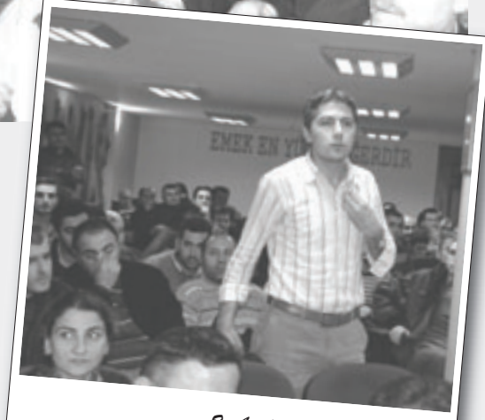
2 Aralık 2008 | İstanbul