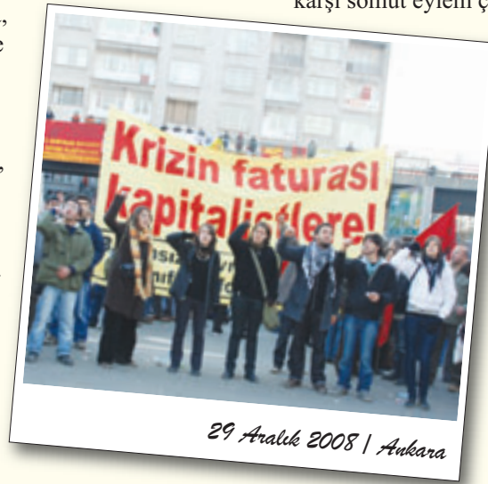
29 Aralık 2008 | Ankara

Krize karşı mücadeleyi büyütecek güçler ortadadır. Mücadelenin muhatapları bellidir. 29 Kasım alanı bunu bir kez daha göstermiştir. Hiç vakit kaybedilmeden, iyi niyet ve temennilerin ötesine geçmeyen talep manzumeleri ve mücadele programları ortaklaştırılmalı, ete-kemiğe büründürülmeli, işçi ve emekçi kitlelere güven ve güç veren devrimci bir mücadele hattı örülmeye çalışılmalıdır. Kuşkusuz, böyle bir mücadelenin hedefinde sadece AKP hükümeti değil, bir bütün olarak emperyalist-kapitalist sistem, işbirlikçi burjuvazi ve onların uşakları olmalıdır.