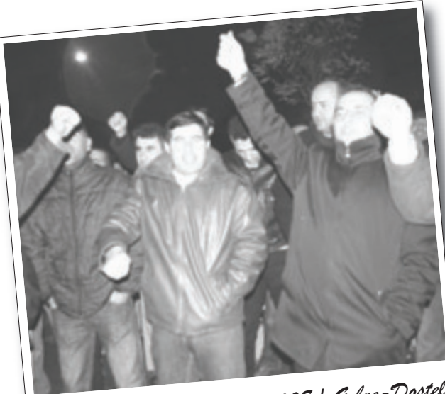
28 Kasım 2008 | Gebze-Dostel