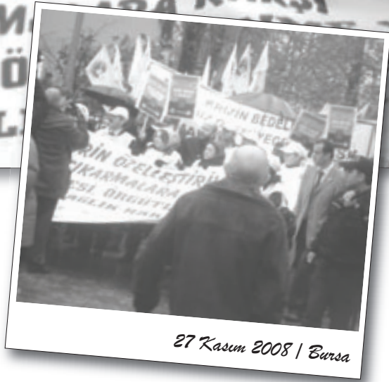
27 Kasım 2008 | Bursa

Birçok kurumun destek verdiği eylemde, “Grev, direniş, yaşasın örgütlü mücadelemiz!”, “Hastaneler bizimdir satılamaz!”, “İşten atılmalar yasaklansın!”, “Kurtuluş yok tek başına, ya hep beraber ya hiçbirimiz!”, “29 Kasım'da Ankara'dayız!” sloganları atıldı. Eyleme yaklaşık 250 kişi katıldı.